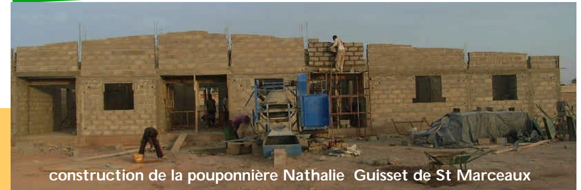
construction de la pouponnière Nathalie Guisset de St Marceaux